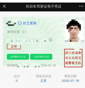
成都2019年起推广的“电子驾照”

件状态保持一致。简单来说，驾驶员遇到路面执法管理、路面检查时、交通违法文书送达时，都可以使用电子驾驶证和电子行驶证。持有成都籍机动车驾驶证的驾驶人，符合申领条件的，可以通过成都交警“蓉e行”平台申领机动车驾驶证电子凭证。所申请相关电子证件目前仅限成都范围使用。