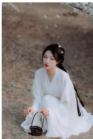
被服罗裳衣,珠花簪于鬓……网友汉服打卡照惊艳众人。