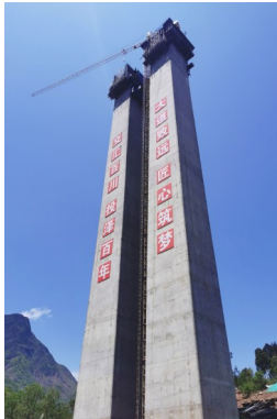
子莫格尼特大桥施工现场。