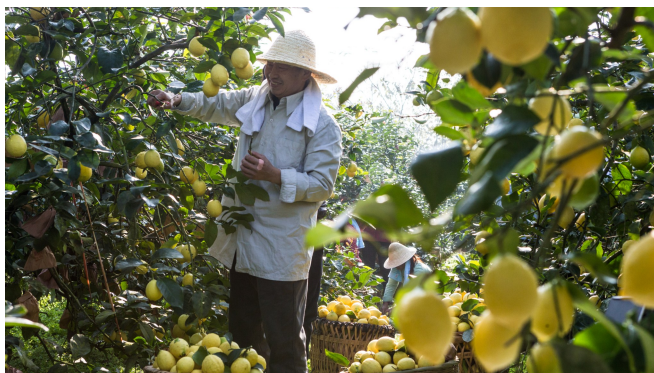
果农正在采摘柠檬。