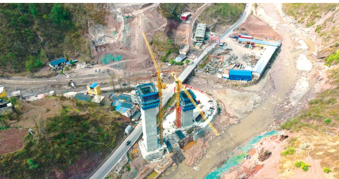
美姑河4号特大桥正在抓紧建设中。

乐西高速起点位于乐山市市中区，途经乐山市市中区、沙湾、沐川、马边、凉山州美姑县、昭觉县，在昭觉县境内连接西(昌)昭(通)高速，路线全长