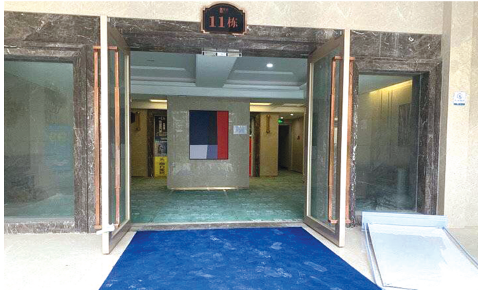
入户大厅宣传与实际对比(上为宣传图片,下为实景图)。