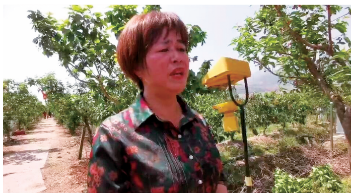
看着丰收的樱桃,谌女士一脸愁容。