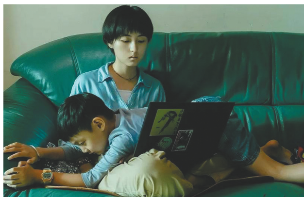
《我的姐姐》因社会话题引关注。