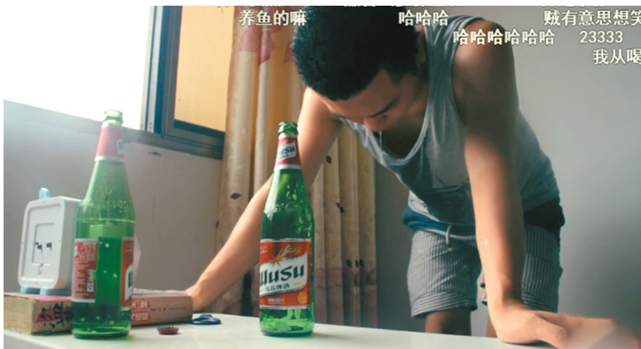
博主挑战喝酒失败，遭到了观看者的嘲笑。视频截图

除了怀疑“酒没下肚”，还有人会对酒的真假也发出了质疑。如果喝的是白酒，有人会问“是不是提前换成了气泡水？”如果喝的是威士忌之类的深色酒，还有人质疑“是不是往里面兑了冰红茶”。正因为有这些争议存在，有些博主发明出了一种验证酒真假的办法——点火。因为酒精可燃，只要瓶子里倒出的液体能点起火来，就证明酒是真酒。这些博主点火的办法各不相同，有些人先把酒倒在杯子里，拿出一块纸巾沾湿，再把纸巾点燃。有些人除了把酒倒在杯子里，还会另外倒一些在桌子上，边点火边喝。还有人为了证明是真喝更是无所不用其极，先是直接嘴对瓶