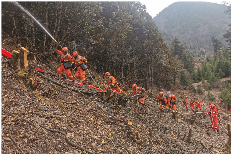
森林草原防灭火应急演练。

同一天,阿坝州金川森林草原防灭火应急演练在金川县勒乌镇金马坪村举行,150余人、300余台灭火装备共进行了18项场景演练。阿坝州和金川县机关单位工作人员、农牧