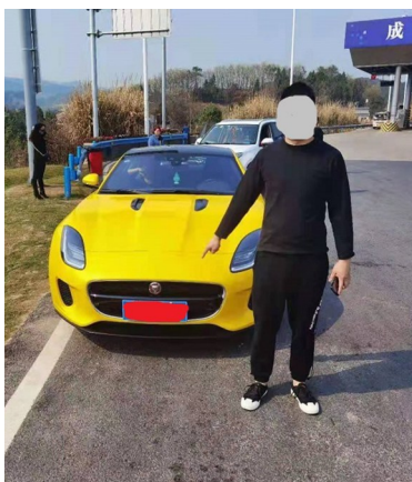
廖某高速路上飙车,超速107.5%。

2月23日,省公安厅交警总队高速交警一支队民警在开展勤务检查工作时发现,一辆黄色捷豹车速飙到