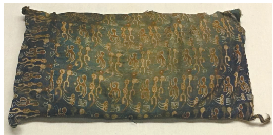
“王侯合昏千秋万岁宜子孙”锦枕。 (新疆维吾尔自治区博物馆藏)

在尼雅遗址发掘中,最有知名度、收获最为丰富的要数1995年的那次发掘。它以一种十分具有“预言”意味的形式,将尼雅遗址拉进了大众的视野,成为当年的十大考古发现之一。