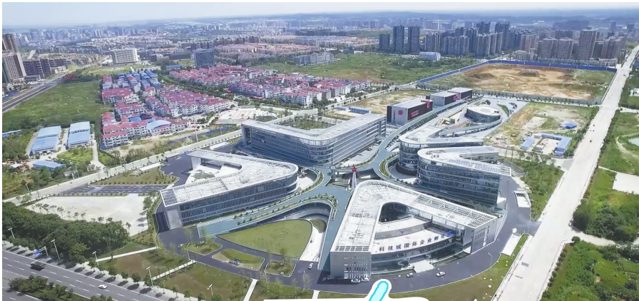
生机勃勃的中国(绵阳)科技城。

例如，绵阳科技城新区依托富集的创新资源，明确必须在科技创新方面展现更多作为，提出打造成渝地区双城经济圈创新高地；成都东部新区强调要“有利于推动成都重庆相向发展，促进成渝地区双城经济圈建设战略实施”；宜宾三江新区要“培育成渝地区双城经济圈重要增长极”；南充临江新区则“有利于加快培育成渝地区双城经济圈高质量发展新动能”。