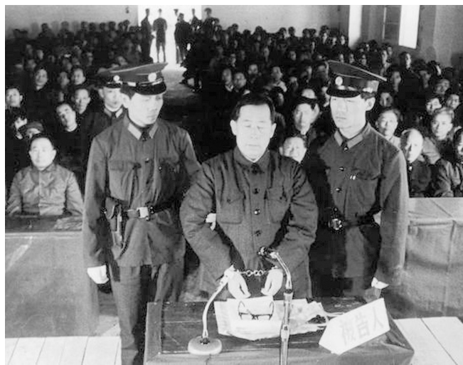
王仲案庭审现场。

蒋秀生还了解到，海丰当时是一个80多万人的大县，而财政收入只有2000多万元，在