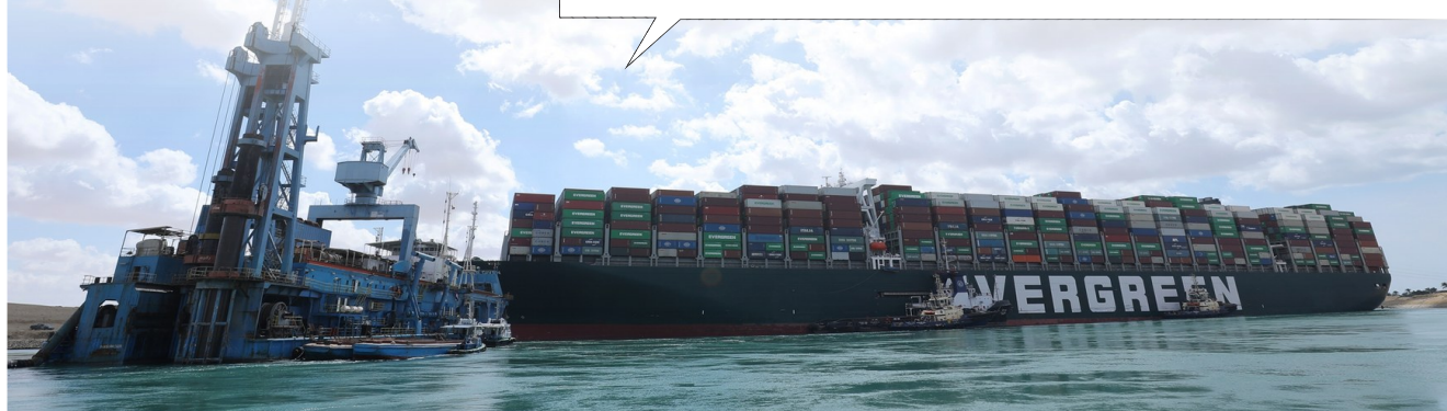
3月26日,救援船只在埃及苏伊士运河上重型货船搁浅现场进行作业。

3月23日,一艘重型货轮在苏伊士运河搁浅,造成航道拥堵,到28日已经是第六天了,目前等待通过的船只已经增至321艘。这场“大堵船”,让这条全球最繁忙海运通道犹如被扼住“咽喉”。