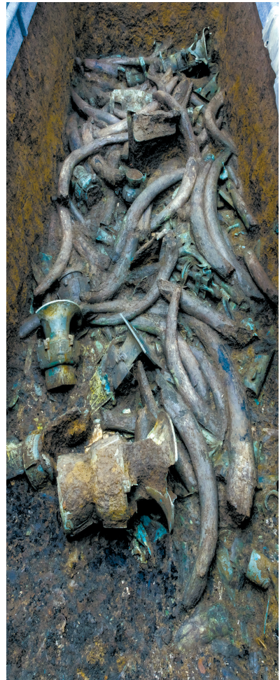
▲ 这是在三星堆遗址考古发掘现场3号“祭祀坑”内拍摄的青铜器和象牙(3月16日摄)。