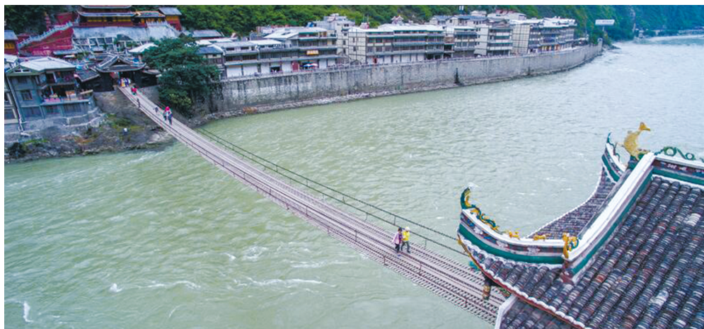
位于甘孜州泸定县的泸定桥。