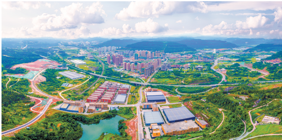
空中鸟瞰巴中经济开发区。

“我们当年落子巴中，就是看中其丰富的劳动力资源、巨大的发展空间和一流的营商环境。”泰美克公司负责人表示，该项目与巴中经开区结缘于第四届科博会，项目仅用半年时间就建成投产，创造了令人赞叹的“经开区速度”。