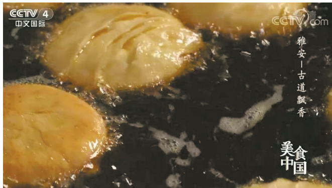
千年茶马古道，造就了沿途各种美食。