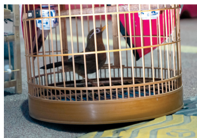
警方现场查获的画眉鸟。

巡警大队民警立即上报分局指挥中心，将此案移交分局经济(环境、食品药品和旅游)犯罪侦查大队(以下简称