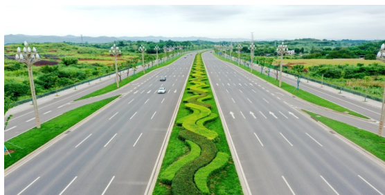
已建成的天府大道仁寿段。

《眉山市建设高新技术产业集聚地行动方案》中提到:到2025年底,力争国省级科技创新平台达到120个以上,国省级科技创业服务载体20个以上,获得省级以上科学技术奖15项以上,高新技术企业数量年均增长10%以上。当年,技术合同交易总额达到2亿元以上,全社会研发经费支出占GDP比重年增长15%以上,研发投入占GDP比重达到1%以上。