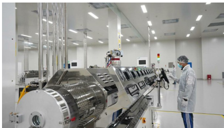
位于眉山天府新区的四川阿格瑞OLED新材料建设项目,拥有自主知识产权,可突破国外专利壁垒。