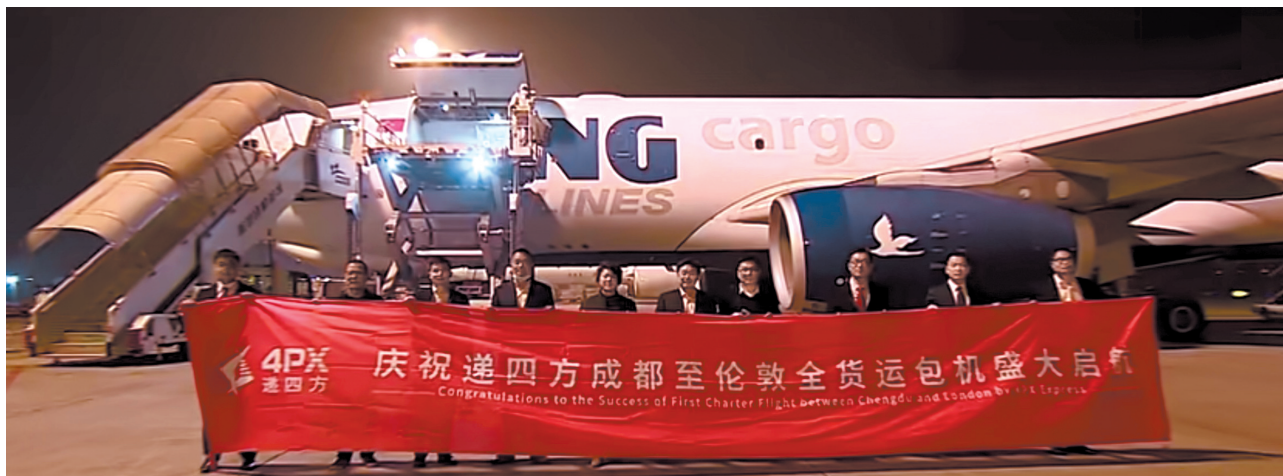
“成都-伦敦”全货机航线15日首航。

3月，成都双流国际机场货运事业密集更新动态：3月14日，“成都-达卡”全货机航线顺利首航；3月15日凌晨4点30分，满载60吨电商包裹的递四方“成都-伦敦”全货机航线包机，从成都双流国际机场顺利起飞。