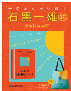
800套赠品版5分钟内被抢完

石黑一雄以英语写作的移民作家身份令人瞩目,他和奈保尔、鲁西迪一起被称为“英国文坛移民三雄”。他之前出版的八部作品为他赢得了包括诺贝尔文学奖和英国布克奖在内的诸多重要文学奖项。