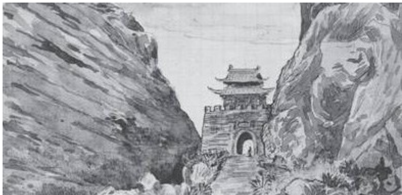
手绘的百年前剑门关。

进入四川境内，伊东忠太去了很多地方，包括双流、新津、新都、彭州、绵阳、德阳罗江、广元、剑门关和泸州等地。在这900余幅手绘图片中，有100余幅都是关于四川的。光是峨眉山，他就用了20多幅绘图，记录下了山上的建筑和自然风光。他受到当地衙门的热情款待，被八抬大轿抬上峨眉山，却在路上发现衙门负责人徇私舞弊。他辞退了轿夫，徒步上山后，随即发现了更多乐趣。