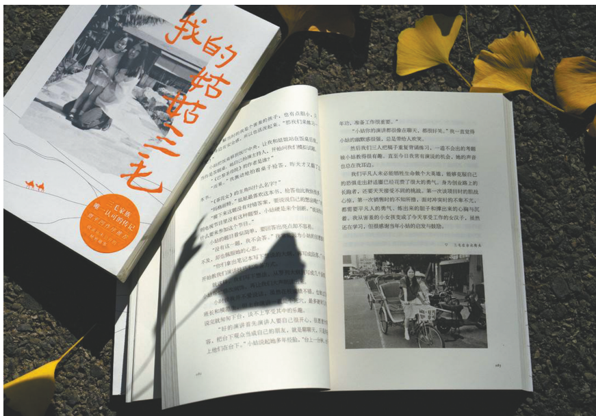
侄女眼中的三毛亲和顽皮。

陈天慈和双胞胎姐姐陈天恩是三毛大弟弟陈圣的女儿，也是三毛那本《送你一匹马》书中提到的“天使”。跟其他解读三毛的书不同，陈天慈不是从一些新闻、书籍、采访中搜集资料，而是讲述自己在少年时代跟三毛在一起生活的日常相处生活细节。“我儿时和青春的回忆里，没有三毛这位大作家，只有一个疼爱我们，又爱和我们一起玩的大孩子三毛，一个总是有些调皮点子，总是让爸爸担心教坏我们不肯睡觉的小姑，一个爱说鬼故事看我们害怕样子的淘气小姑。”她写道。这样的日常角度，也获得了作家贾平凹的肯定。他在为该书所作的序文中说自己“在一天半的时间里读完这本书，它给了我们另一个真实的三毛。由衷地说，这是我读过写三毛最好的一本书。”