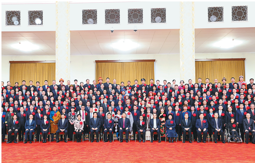
▲ 2月25日,全国脱贫攻坚总结表彰大会在北京人民大会堂隆重举行。会前,习近平等会见全国脱贫攻坚楷模荣誉称号获得者,全国脱贫攻坚先进个人、先进集体代表,全国脱贫攻坚楷模荣誉称号个人获得者和因公牺牲全国脱贫攻坚先进个人亲属代表等,并同大家合影留念。

新华社北京2月25日电 全国脱贫攻坚总结表彰大会25日上午在北京人民大会堂隆重举行。中共中央总书记、国家主席、中央军委主席习近平向全国脱贫攻坚楷模荣誉称号获得者等颁奖并发表重要讲话。习近平强调,经过全党全国各族人民共同努力,在迎来中国共产党成立一百周年的重要时刻,我国脱贫攻坚战取得了全面胜利,现行标准下9899万农村贫困人口全部脱贫,832个贫困县全部摘帽,12.8万个贫困村全部出列,区域性整体贫困得到解决,完成了消除绝对贫困的艰巨任务,创造了又一个彪炳史册的人间奇迹!这是中国人民的伟大光荣,是中国共产党的伟大光荣,是中华民族的伟大光荣。