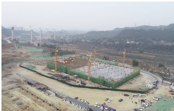
巴中临港产业园施工现场一派忙碌。

2020年10月,各种大型机械打破山野的宁静,大规模推山填谷,总计挖填土石方130万立方米,平整场地380余亩。完成这一切,只用了不到4个月时间,创造了令人惊叹的“空港速度”。