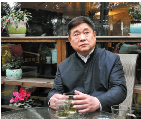
单霁翔希望观众通过节目更深入地了解都江堰。

2月20日，单霁翔与《万里走单骑——遗产里的中国》节目组抵达都江堰，踏上探索遗产地的旅程，他们将作为遗产地的守护者、研究者、居住者、见证者、体验者相遇、同行，在互动体验中挖掘隐藏在遗产地背后的价值与魅力。