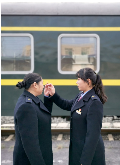
女儿(右)和妈妈完成了春运的传承。