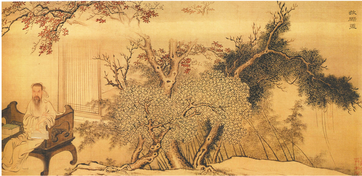
《王士禛放鹞图卷》清 禹之鼎