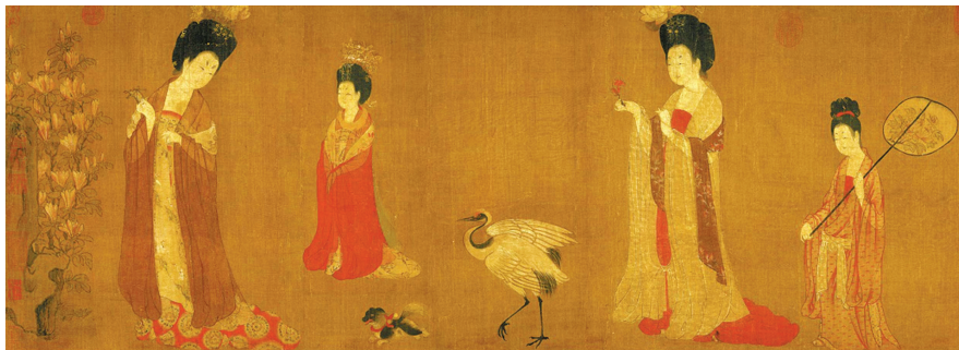
唐代周昉绘制的《簪花仕女图》(局部)。