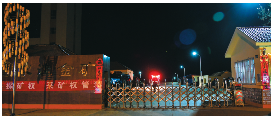
发生事故的招远市夏甸镇曹家洼金矿。

发生火灾。接到报告后，山东迅速成立省市县一体化应急救援指挥部，全力以赴搜救被困人员。国家应急管理部也派出工作组指导救援。省市有关方面短时间内调集消防救援、矿山救护等专业救援力量近200人开展救援。 据新华网