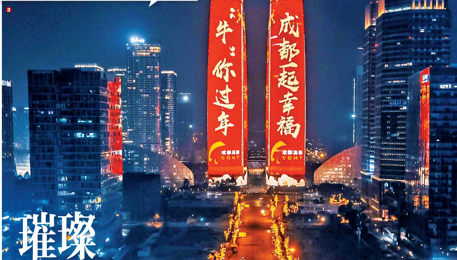
图3:成都金融城双子塔绚丽多彩的灯光秀。