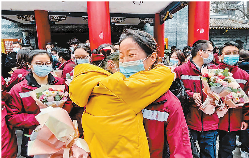
2月9日，川大华西医院65名抗疫外派医疗队队员结束隔离，与家人、同事团聚。

1月18日凌晨，华西医院接到国家卫健委通知，要求增派医务人员支援河北石家庄。从接到命令到赶赴救援一线，仅仅花了14个小时。华西医院医护人员接管了石家庄市人民医院新冠重症一区，医疗队共收治了新冠患者33人，其中包括危重型8人、重型26人。经过16天无休息奋战，医疗队实现了新冠患者零死亡、医护零感染目标，圆满完成救治任务。