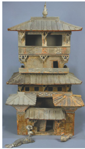
四层刻线纹彩绘陶仓楼。焦作市博物馆