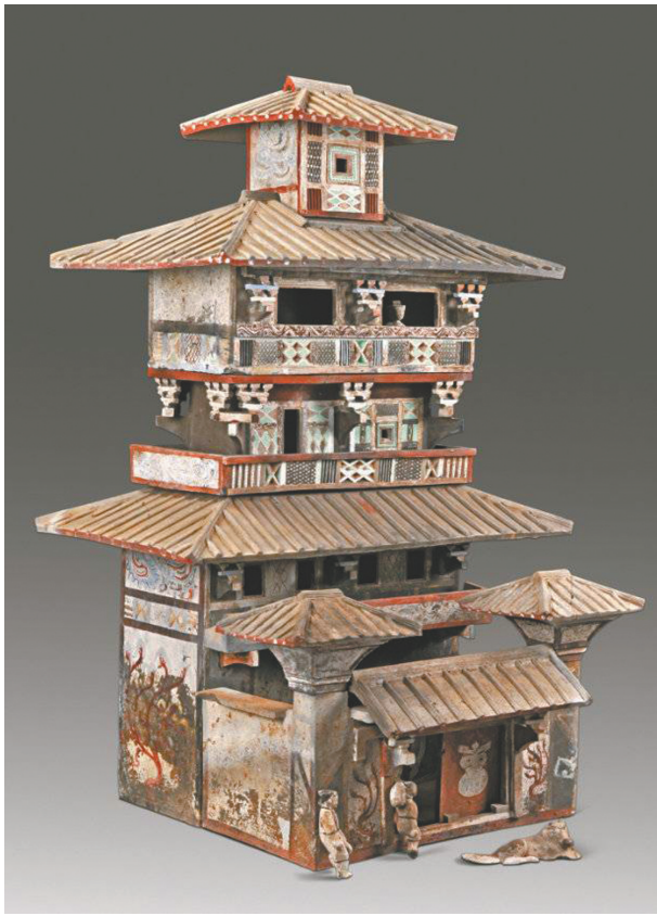
五层彩绘陶仓楼。焦作市博物馆

此外，被称为“南都帝乡”的宛，在汉武帝时期已是汉、江、淮间的经济中心，后因光武帝刘秀起兵于此，即位后多次“衣锦还乡”，更加促进了宛文化、商业和歌舞宴乐的发展。或许正因如此，南阳地区汉墓中出土了大量充满浓郁生活气息的文物，其中尤以陶狗为最，南阳陶狗与画像石、画像砖一起，被称为“南阳三宝”。