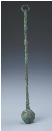
铜汲酒器。淄博市博物馆

成博新展将通过“五都”所在地域考古出土的300余件/套精美文物，全方位展示秦汉大一统历史背景下，蓬勃繁荣而又迥异多姿的城市风貌、风土人情。