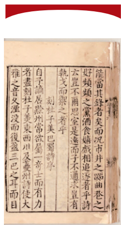
宋本《豫章先生集·卷第十六·序·刻杜子美巴蜀诗序》。

黄庭坚离开戎州后，士民怀念他，为他修建纪念性建筑二老阁、涪翁祠。1980年，宜宾市政府还在流杯池旁重建了吊黄楼。