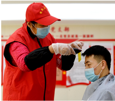
2月6日，志愿者在石家庄给外来务工人员理发。

位吃住，各村、小区居家隔离，留出民生保障通道，重点乡镇和集中隔离点每两天一次单人单管核酸检测。同时，开展全域消杀工作，对增村镇小果庄村等重点区域，逐家逐户进行环境消杀。2月3日起，解除隔离医学观察人员在政府组织下陆续返家。