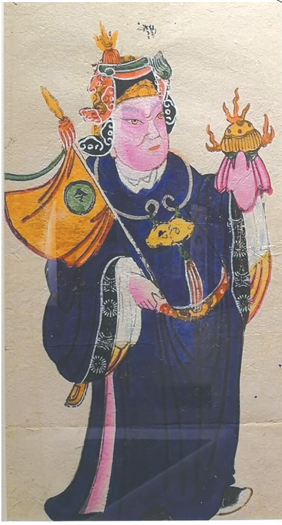
《令旗门神》（左），清代（四川绵竹印本着色）。

清光绪《增修登州府志》载：“元旦”即正月初一，“五更，盥沐毕，先迎喜神，随方向拜之。设燎，陈盘案，礼百神，祀先祖。”民国时期《乌青镇志》载：“元旦，出门，走喜神方；妇女赴神庙拈香，名十庙香。”正月初一开门出行前，须从黄历上寻出喜神方，再循此方向而行，叫作走喜神方。诸如此类，都是为了求得喜神保佑，而获取好运。