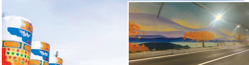
狮子坪隧道里的枫叶森林彩绘。