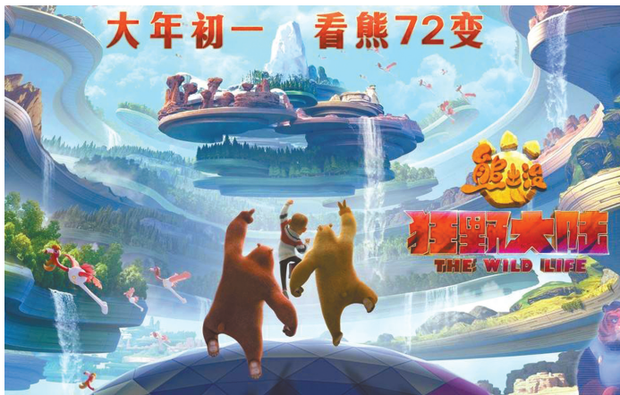
《熊出没·狂野大陆》海报。