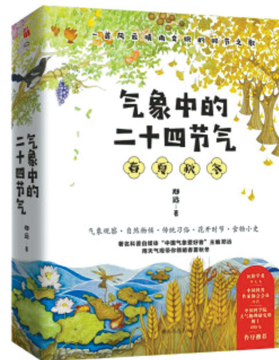
《气象中的二十四节气》

华文天下新近出版的《气象中的二十四节气》告诉你，立春的“春天”并不是现代气象学意义上的春天，而更多的是指天文意义上的春天。这是一套有助于我们听懂和读懂大自然语言的节气科普读本。