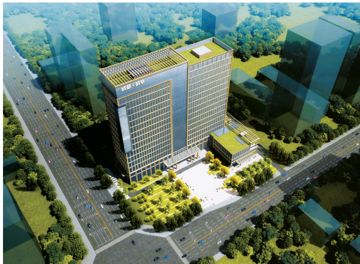
成都市成华区新经济产业服务中心项目效果图。

据悉,该项目是成华区构建“3+3”现代都市工业体系,大力发展总部工业、楼宇工业、新型工