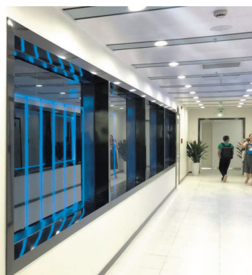
成都市金牛区城市数据湖项目。

“成都市内各区县,也积极为推动经济高质量发展注入新的动力源泉,不断开拓思路发展新经济培育新动能。”