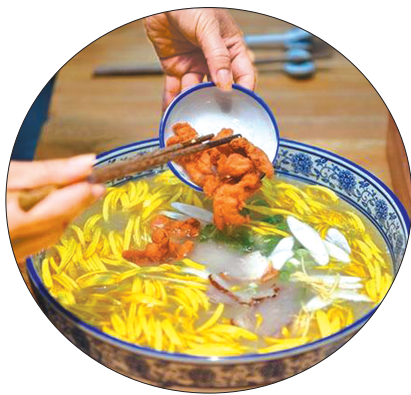
过桥米线配菜众多。据中新社