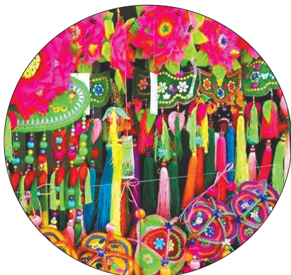
多彩香包。据新华社

岁月流转，香水和化学香料顶替了香包的位置。我在翠湖边看见有香包出售，也是被人当成纪念品买来送人，或放在私家车里做摆设。