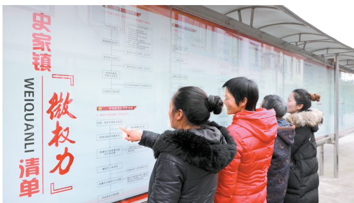
内江市市中区史家镇村干部了解公开栏的“小微权力”清单。

为保障“小微权力”规范运行体系正常运行，内江市市中区出台了《关于全面推行村级事务“小微权力”清单制度的实施意见》《关于加强党务政务村务公开责任追究暂行办法》《关于对