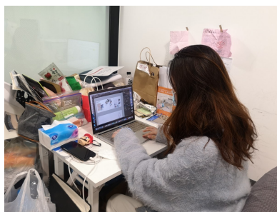
小曹在工作室工作。