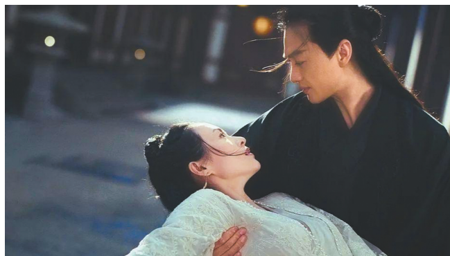
“喧嚣夫妇”甜度爆表。

戏用一位少年演员,18岁时的戏呢?子怡从18岁的阿妩演起,就不会被批评年龄与角色不符了吗?若用少年演员,能撑起这个阶段生离死别的重戏吗?或许这是个见仁见智的问题,究竟怎样处理更好,怎样衡量取舍,恐怕每个人有不一样的答案。”在寐语者看来,章子怡做到了将少女阿妩和后来的豫章王妃集于一身。