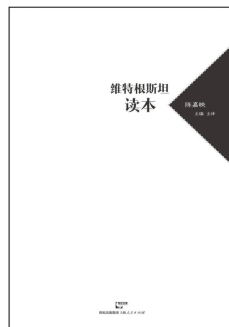
陈嘉映主编主译的《维特根斯坦读本》。

陈嘉映一向主张取消哲学本科，理由是本科生应该进行通识教育，踏踏实实学习基本知识。“如果学生没有任何专业基础，一上来就弄哲学，容易把哲学做空。”因为哲学是对经验的反思，对知识的反思。十八九岁的学生，没有多少人生经验，没有专业知识，反思什么？如果对伟大哲学家基于深厚经验和广博知识而来的思想无所体会，学哲学就会变成从概念到概念的空洞运转。