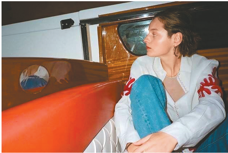
现实生活中的艾玛·科林。