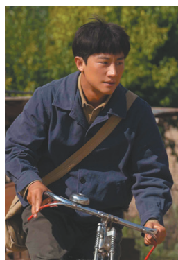
黄轩在剧中饰演村干部。