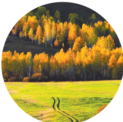
大兴安岭林区秋景。

大兴安岭凭借其辽阔的地域和得天独厚的气候环境,保存着我国最大、最完好的原始森林,成为我国十分宝贵的寒温带生物资源库。巍巍青山,茫茫林海,坐落于大兴安岭北段西坡的根河,植被资源也相当丰富,森林覆盖率达91.7%,是全国森林覆盖率最高的县级市。兴安落叶松是根河森林的主人,分布很广,十分耐寒,多年来风吹不动、雷击不倒地在大兴安岭山脉上生长着。