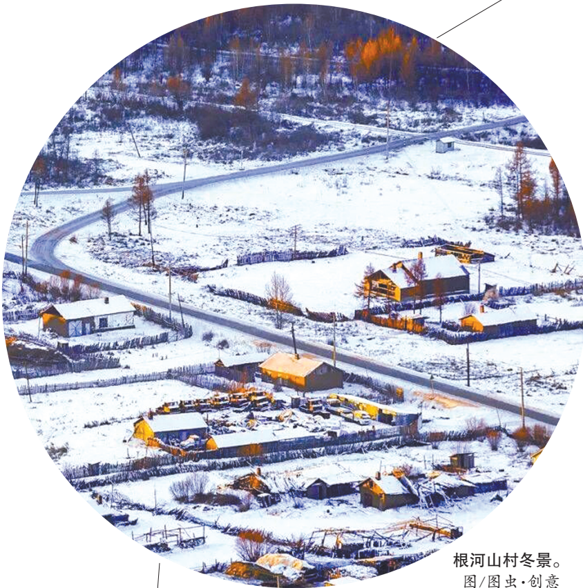
根河山村冬景。

对比两地的最冷月平均温度和低温持续时间的数据得知,两地近二十年中,最冷月以及最冷月平均气温相差无几。可是根河市连续-40℃以下的极寒天数平均可达13天之久,而漠河仅有11天。由此看来,根河的“中国冷极”称号当之无愧。