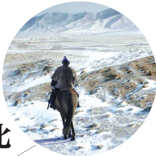
野外的鄂温克族骑手。