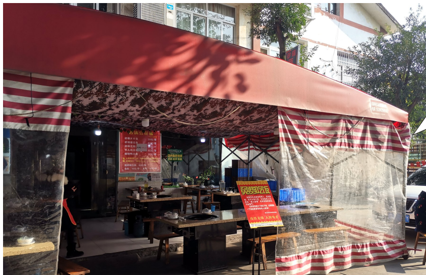
位于小巷的爱心餐馆。

餐馆老板告诉记者，“单人套餐”主要面向那些正处于窘境，或吃不上饱饭的人。她希望这口“热饭”，能传递出更多希望和爱心。