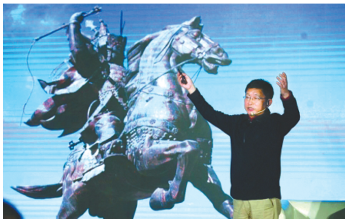
阿来为大家讲述格萨尔王传奇。