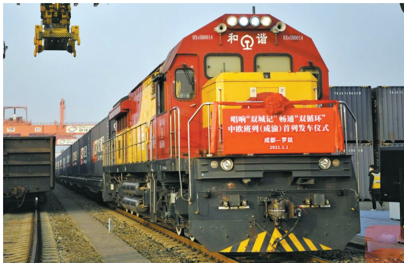
1月1日,中欧班列(成渝)号在成渝两地举行发车仪式。

这是国铁集团首次批准两地中欧班列统一品牌,并使用统一名称开展品牌宣传推广。中欧班列(成渝)将肩负积极探索中欧班列高质量发展的使命,打造合作共建、高效运营的样板。